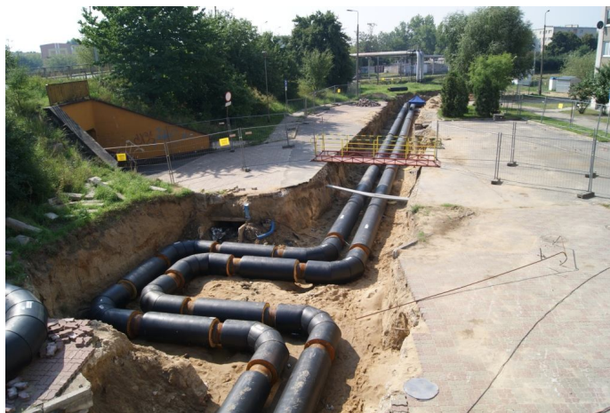
Wymiana podziemnej sieci ciepłowniczej w ul. Przemysłowej