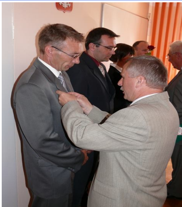
Prezydent Kazimierz Pałasz wręcza odznaczenia pracownikom MPEC-KONIN