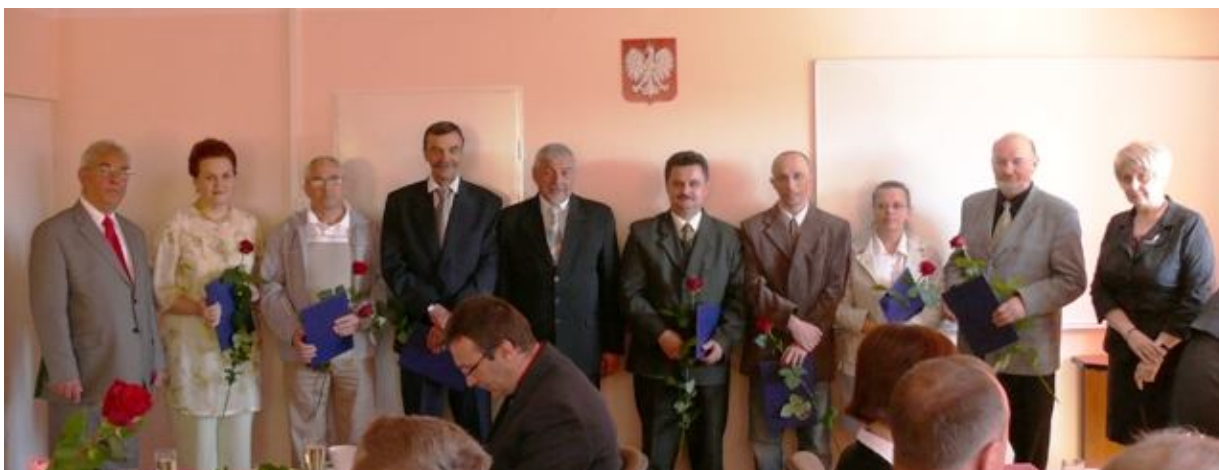
Wyróżnieni dyplomem Prezesa Firmy z Zarządem Spółki.