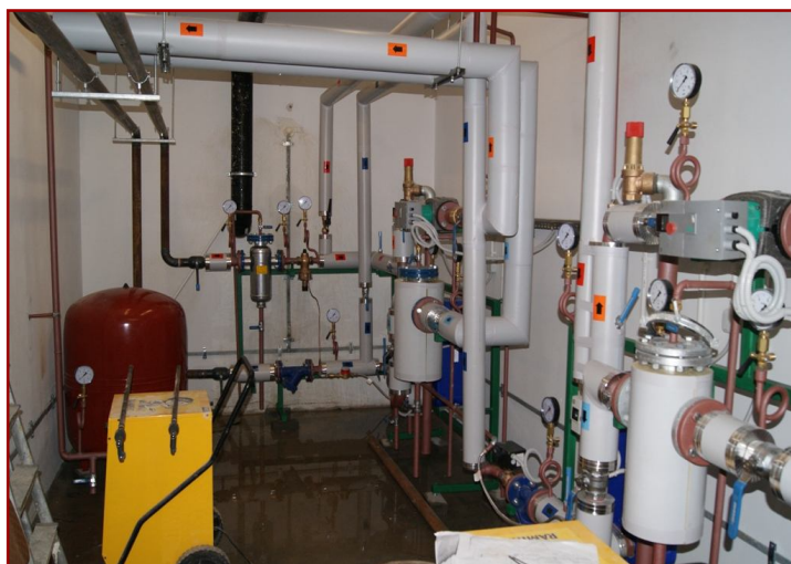
Węzeł cieplny w czasie budowy

re zakończone zostały 30-09-2010. Moc cieplna wykonanego węzła to 385 kW, z czego 245 kW to moc dla instalacji centralnego ogrzewania, a 140 kW moc na potrzeby ciepła technicznego. (P.M)