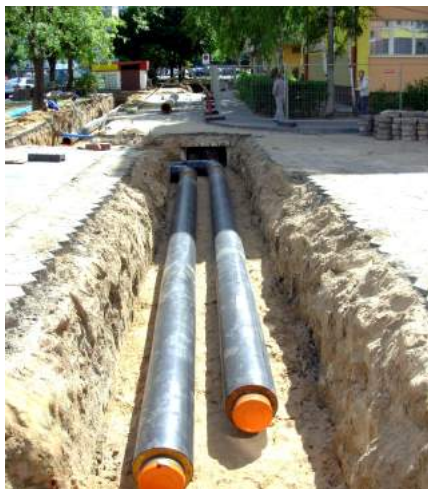
Wymiana starych sieci na preizolowane

W ramach kontynuacji inwestycji rozpoczętych w latach poprzednich planowana jest likwidacja sieci ciepłowniczych niskoparametrowych i budowa w ich miejsce sieci wysokoparametrowej z rur preizolowanych, wraz z wykonaniem w budynkach dwufunkcyjnych węzłów ciepłych, umożliwiających całoroczną dostawę ciepła na potrzeby ogrzewania i przygotowania ciepłej wody użytkowej do lokali mieszkalnych. W bieżącym roku zakładane jest wykonanie sieci z przyłączami do budynków osiedla „pierwszego” (od średnicy 32 mm do średnicy 80 – łącznie ok. 550 mb) oraz węzłów ciepłych dla budynków przy ul. Górniczej 2, 4, 6 i Energetyka 1, 3 oraz al. 1 Maja 12, 14.