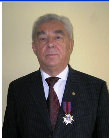
W tym roku Związek Inwalidów

Wojennych RP obchodził 90 rocznicę powstania. W dniu 8 kwietnia 2008 roku, w Ratuszu, odbyło się z tej okazji Walne Zgromadzenie Oddziału w Koninie.