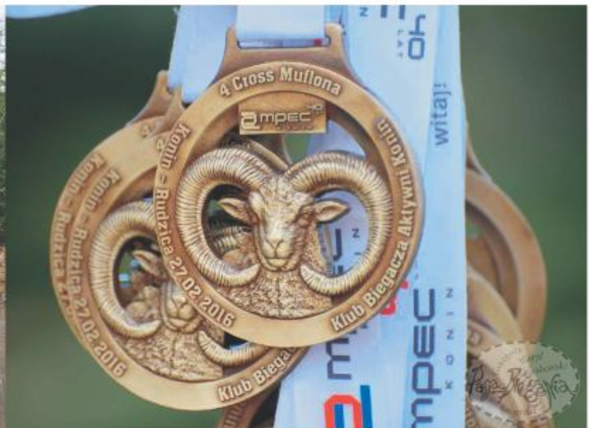
Medale w Crossie Muflona ufundowała nasza Firma