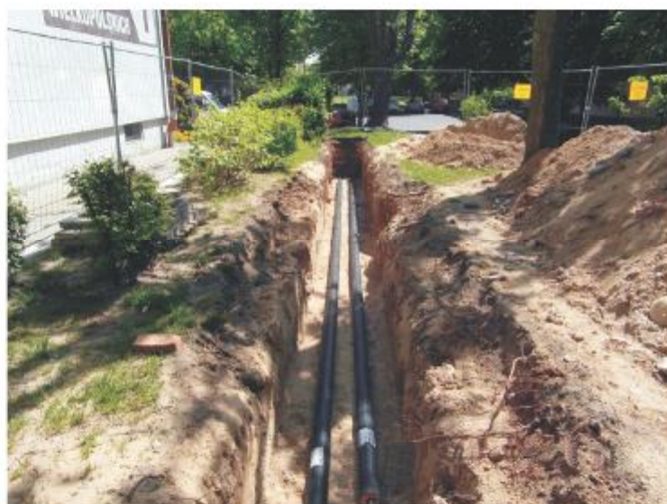
Wymiana sieci ciepłowniczej na preizolowaną

Tak jak w latach ubiegłych wykonywane będą nowe podłączenia do miejskiej sieci ciepłowniczej. J.M.