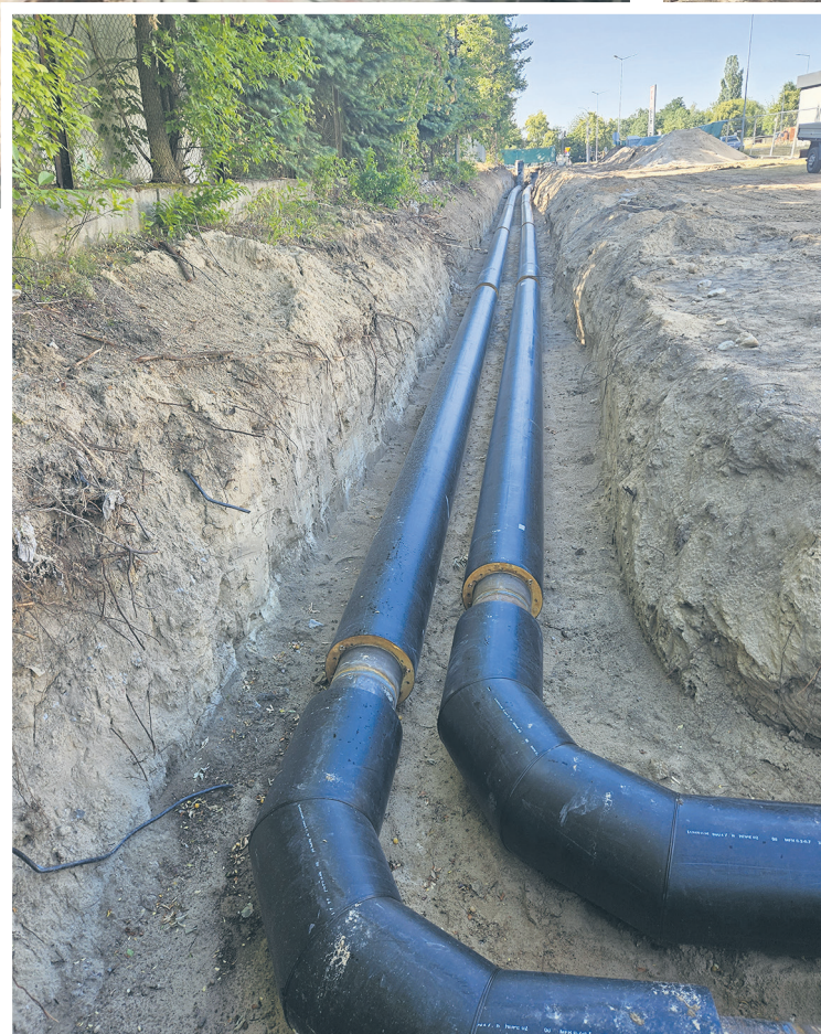
Przebudowa sieci ciepłowniczej w rejonie Kauflandu i budynku ZUS-u

naszego systemu ciepłowniczego – wyjaśnia Maciej Pawlak, kierownik Działu Technicznego MPEC-Konin. Obecnie przebudowywana jest sieć ciepłownicza w rejonie budynków przy ul. Wyszyńskiego 12, 14, 16, 18, 20, 22. Mowa jest o prawie 200-metrowym odcinku, natomiast ponad 100 metrów mają przyłącza do budynków. – Prace realizowane są na podstawie projektu opracowanego w 2019 roku przez służby projektowe naszej spółki oraz decyzji pozwolenia na budowę. W efekcie tych prac zlikwidowane zostaną sieć i przyłącza ciepłownicze kanałowe, w których izolację termiczną stanowił pianobeton – dodaje Maciej Pawlak. Równolegle trwają prace przy ulicy Młodzieżowej, od ulicy Pionierów do Spokojnej, na Glince. – W ramach przebudowy zostaną wykonane odgałęzienia w kierunku