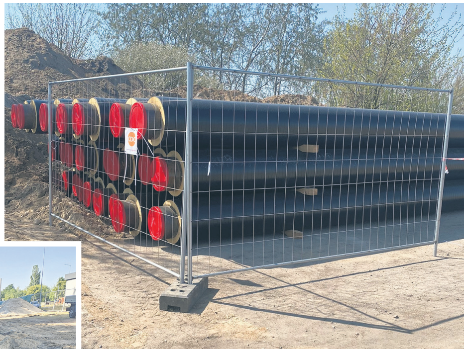
Skład rur preizolowanych

armatury a także uzupełnienie izolacji antykorozyjnej i termicznej – mówi Krzysztof Nowak, kierownik Działu Eksploatacji MPEC-Konin. – Podobne prace są prowadzone w zakresie przeglądów i konserwacji węzłów ciepłych. Okres letni jest dobrym czasem na usunięcie docelowe usterek i awarii na sieci ciepłowniczej i węzłach ciepłych ujawnionych w sezonie grzewczym.