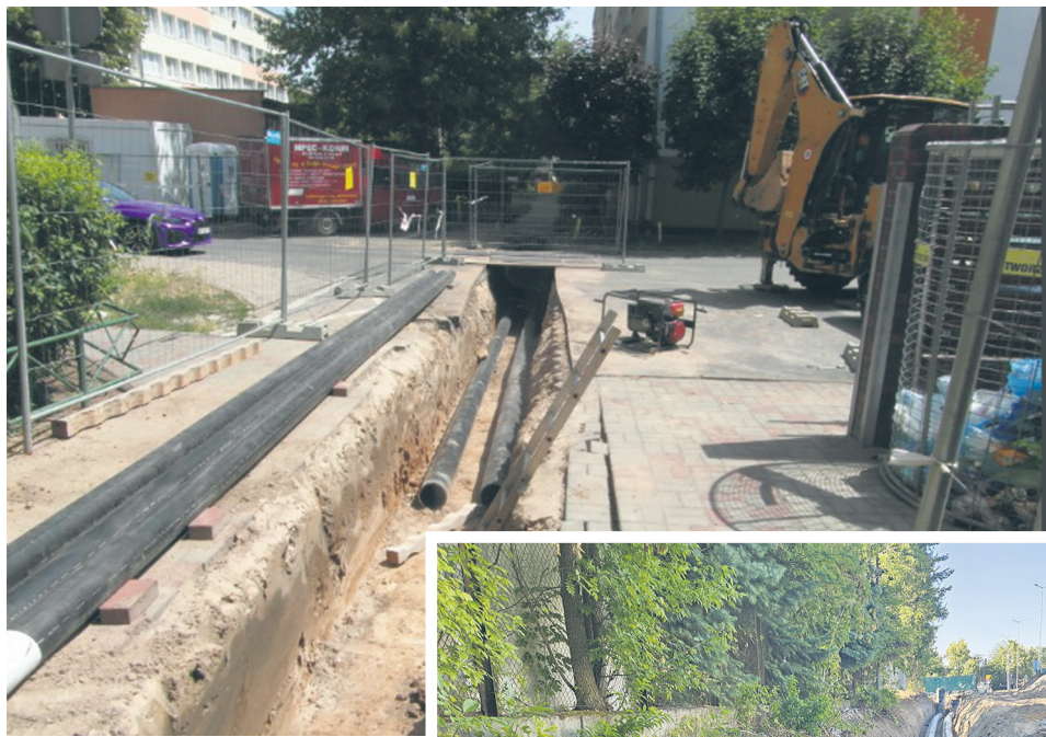
Sieć preizolowana – ulica Wyszyńskiego

-u. Wymieniana jest kanałowa sieć ciepłownicza o średnicy 700 mm na sieć preizolowaną o średnicy 400 mm na odcinku około 295 metrów oraz napowietrzna sieć ciepłownicza o średnicy 700 mm na preizolowaną o średnicy 350 mm na odcinku 92 metrów. Jak informuje Maciej Pawlak, zakończenie prac planowane jest na wrzesień 2023 roku, a wykonawcą prac jest Construction Development Center Sp. z o.o. z Poznania. W ramach drugiego wymienionego zadania, trwa budowa sieci i przyłączy ciepłowniczych oraz indywidualnych węzłów ciepłowniczych w 15 obiektach w rejonie ulic Szymanowskiego, Bacewicz, Noskowskiego i Karłowicza, a także na osiedlu Sikorskiego w rejonie