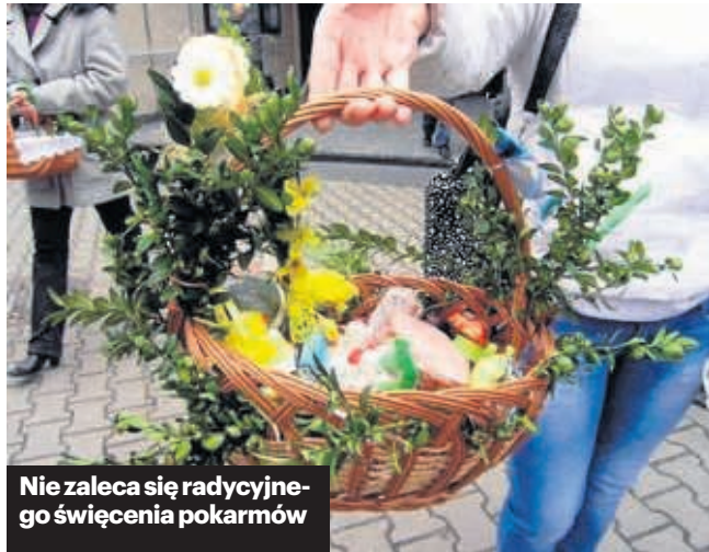
Nie zaleca się tradycyjnego święcenia pokarmów

- Kościół Powszechny znalazł się w nadzwyczajnej sytuacji. Pierwszy raz od wielu wieków Ojciec Święty będzie sprawował Liturgię Wielkiego Tygodnia bez szerszego udziału wiernych, z wyjątkiem asysty liturgicznej - podkreślają duchowni. Episkopat przypomina biskupom o konieczności udzielenia kolejnej dyspensy od obowiązku uczestnictwa w niedzielnej Mszy Świętej w związku z ograniczeniami liczby wiernych mogących uczestniczyć w liturgii. W okresie Wielkiego Tygodnia m.in. nie zalecają organizowania tradycyjnego święcenia pokarmów. Na co jeszcze zwracają uwagę duchowni podczas Triduum?