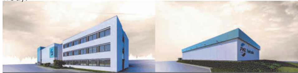
Budynek technologiczny / Zbiornik wody czystej

Istotnym elementem inwestycji jest system dezynfekcji wody . Chlor gazowy zastąpiony został dezynfekcją podchlorynem sodowym produkowanym na miejscu metodą elektrolizy soli spożywczej, co ogranicza koszty eksploatacji i zmniejszy ryzyko związane z magazynowaniem chloru na terenie SUW. Zainstalowana zostanie również lampa UV. Dzięki temu woda uzdatniona będzie charakteryzować się niskim zapotrzebowaniem na chlor. Nowy układ dezynfekcji zapewnia bezpieczne dozowanie podchlorynu sodowego proporcjonalnie do przepływu wody.