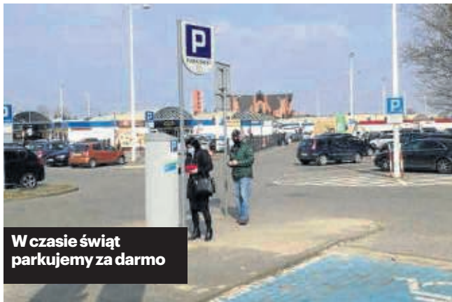
W czasie świąt parkujemy za darmo