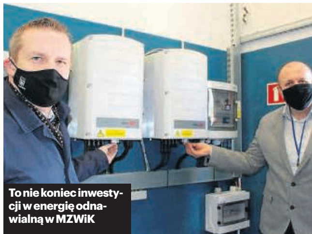
To nie koniec inwestycji w energię odnawialną w MZWIK