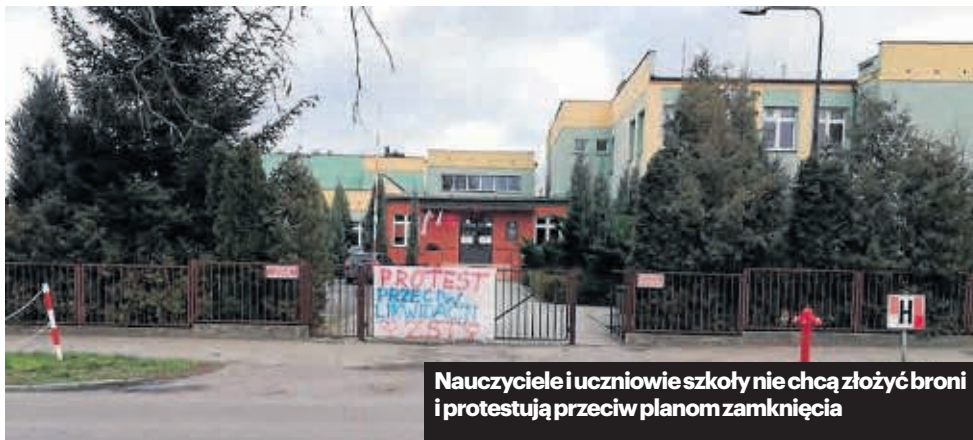
Nauczyciele i uczniowie szkoły nie chcą złożyć broni i protestują przeciw planom zamknięcia

Społeczność szkolna złożyła u Wielkopolskiego Kura-