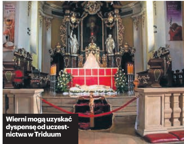
Wierni mogą uzyskać dyspensę od uczestnictwa w Triduum

przyrzeczeń kapłańskich w innym terminie, np. z okazji święceń prezbiteratu, po ustaniu restrykcji związanych z zagrożeniem; - z racji duszpasterskich „miejscowy Ordynariusz może zezwolić na odprawienie drugiej Mszy św. w kościołach i kaplicach, w godzinach wieczornych, a w razie przewidzianej koniecz-