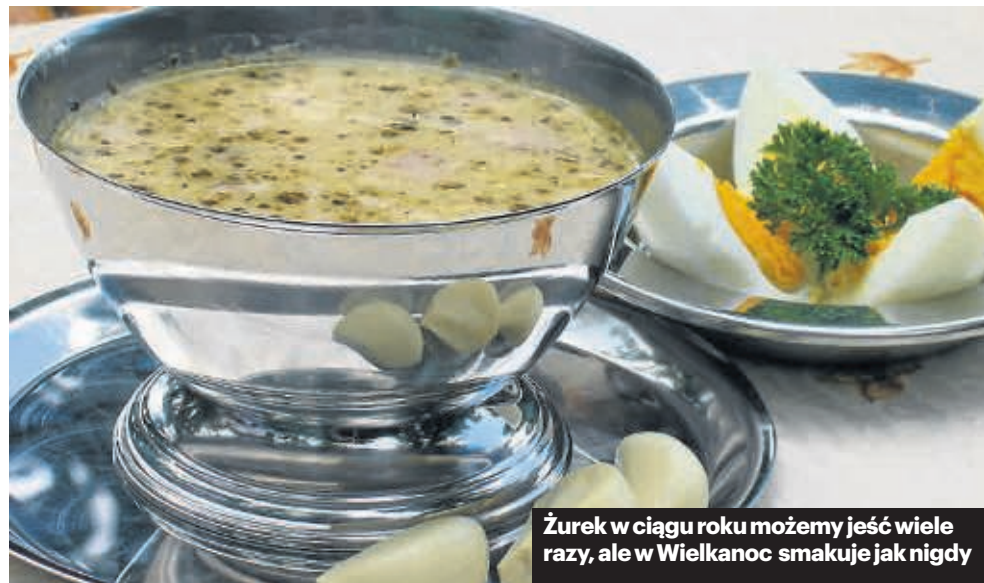
Żurek w ciągu roku możemy jeść wiele razy, ale w Wielkanoc smakuje jak nigdy