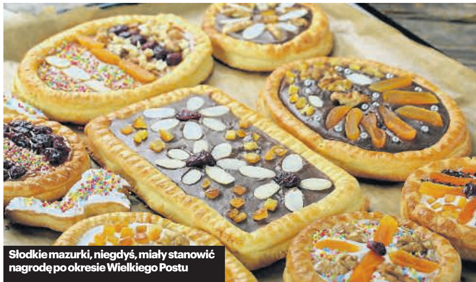
Słodkie mazurki, niegdyś, miały stanowić nagrodę po okresie Wielkiego Postu

Białą kiełbasę podsmażyć na patelni na złoty kolor z obu stron, chwilę podduśić pod przykryciem, następnie pokroić w cząstki i dodać do zupy. Na tej samej patelni podsmażyć cebulę pokrojoną w kostkę i także dodać do zupy. Doprawić do smaku pieprzem czarnym, ziołowym, cukrem i majerankiem. Pod koniec gotowania dodać wyciśnięty przez praskę czosnek. Zupę podawać z jajkiem na twardo.