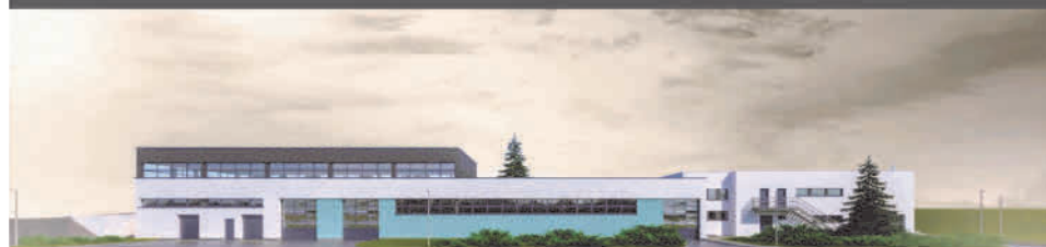
Warsztat, pompownia i budynek energetyczny