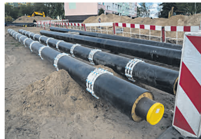
Rury preizolowane przeznaczone do montażu w rurach osłonowych

Prócz realizacji trzech wymienionych wyżej sztandarowych inwestycji, miasto Konin w uzgodnieniu z MPEC-em realizowało w ostatnim czasie wiele mniejszych przedsięwzięć mających ogromne znaczenie z lokalnego punktu widzenia. Wśród nich