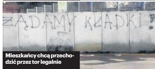
Mieszkańcy chcą przechodzić przez tor legalnie

niewielki jedynie pozornie - patrząc z perspektywy torów. Mieszkańcy Okólnej nie mają komfortowego dojazdu do łącznika ulic Paderewskiego i Wyzwolenia, które prowadziłyby wzdłuż trakcji, więc ich piesza podróż uległa znacznemu wydłużeniu. Wielu mieszkańców ryzykuje i przechodzi w tamtym miejscu przez torowisko.