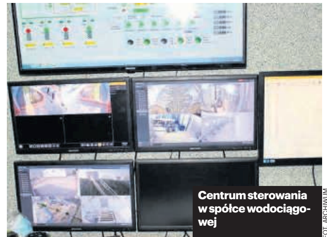
Centrum sterowania w spółce wodociągowej