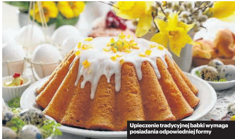
Upieczenie tradycyjnej babki wymaga posiadania odpowiedniej formy