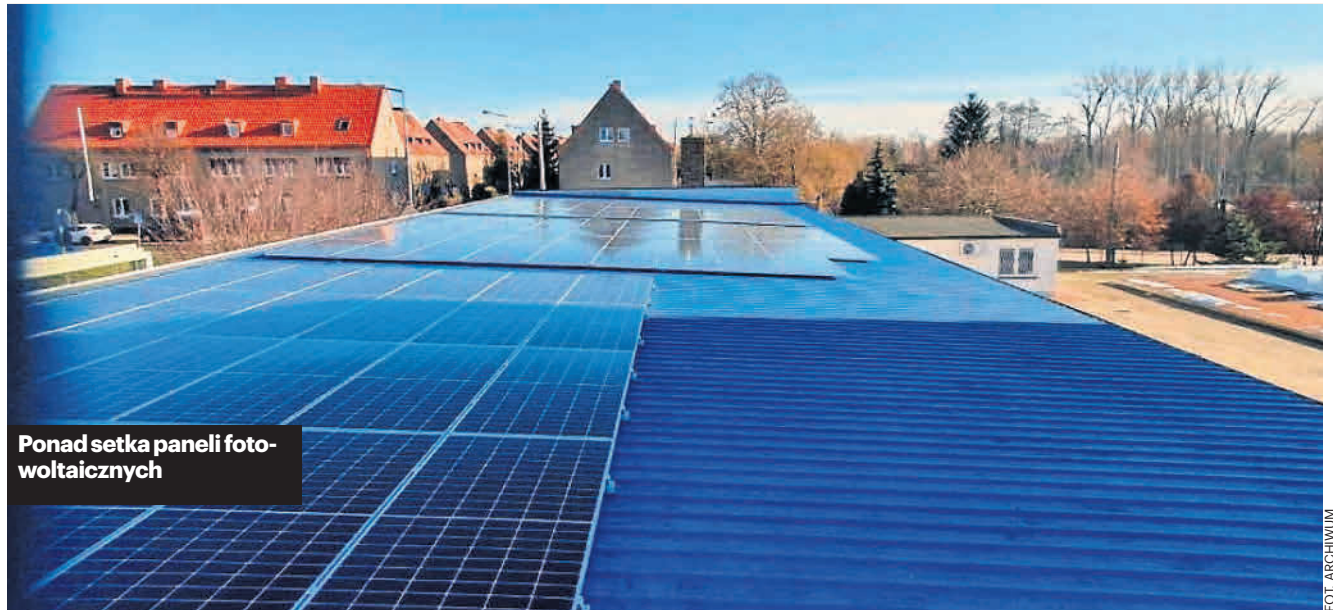
Ponad setka paneli fotowoltaicznych

- Spółka dynamicznie się przeobraża, bo kierują nią fachowcy, oby tak dalej - zakończył wóldarz.