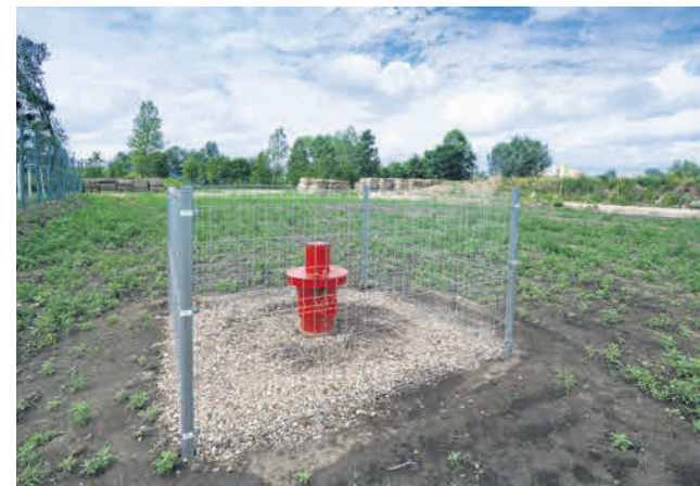
Głowica otworu geotermalnego Konin GT-1

Przedsięwzięcie polega na przebudowie sieci ciepłowniczej w ul. Leśnej, likwidacji nieefektywnych elementów sieci oraz budowie nowych węzłów ciepłowniczych. W ramach robót zlikwidowanych będzie 8 węzłów grupowych (7 na osiedlu Zatorze, 1 na osiedlu Sikorskiego), a w ich miejsce powstanie 29 węzłów indywidualnych. Projekt realizowany będzie do 2023 roku i zapewni poprawę efektywności oraz zmniejszenie awaryjności sieci w tych lokalizacjach. Dzięki zastosowaniu nowoczesnych