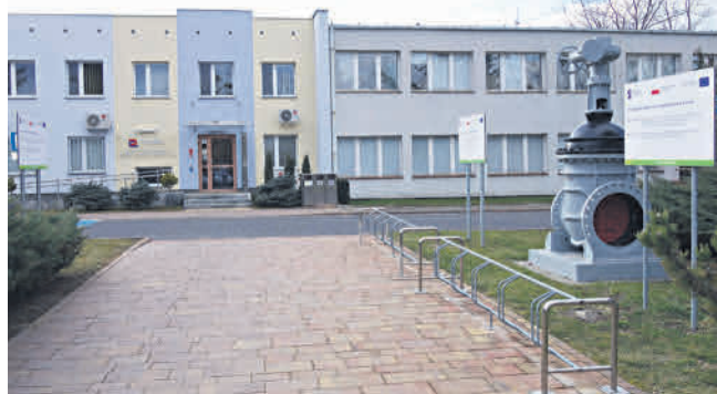
Siedziba MPEC-Konin przy ulicy Gajowej

Systematycznie wykonywane są też nowe przyłączenia do miejskiej sieci ciepłowniczej.