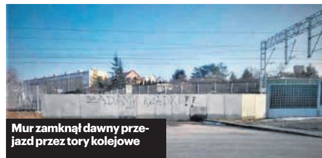
Mur zamknął dawny przejazd przez tory kolejowe

Alternatywą byłby tunel, podobny do tego, który łączy ulice Torową i Kolejową w miejscu zlikwidowanego przejścia. Niestety, również i ten pomysł PKP PLK oceniły negatywnie - ze względu na rzekomą bliskość wiaduktu od ulicy Okólnej. Kolejne nie wzięły pod uwagę jednak tego, że dystans od dawnego przejazdu do wiaduktu jest