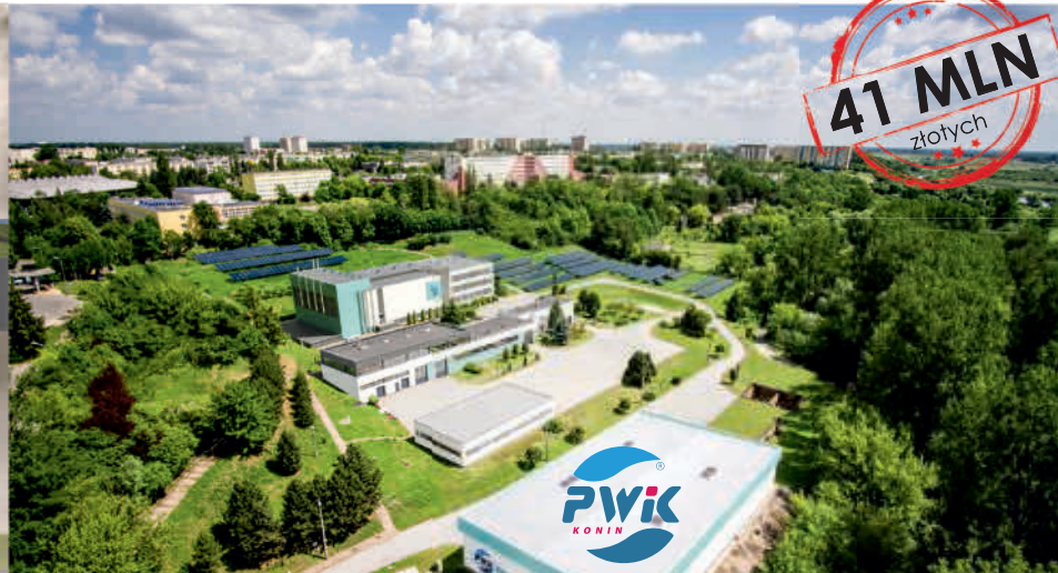
Teren inwestycji - SUW wizualizacja