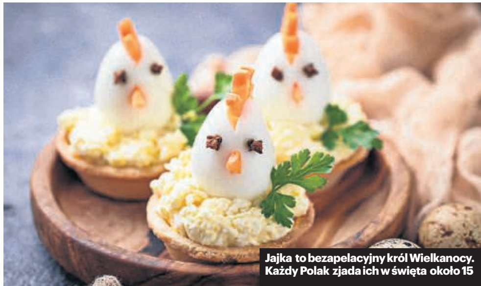
Jajka to bezapelacyjny król Wielkanocy. Każdy Polak zjada ich w święta około 15